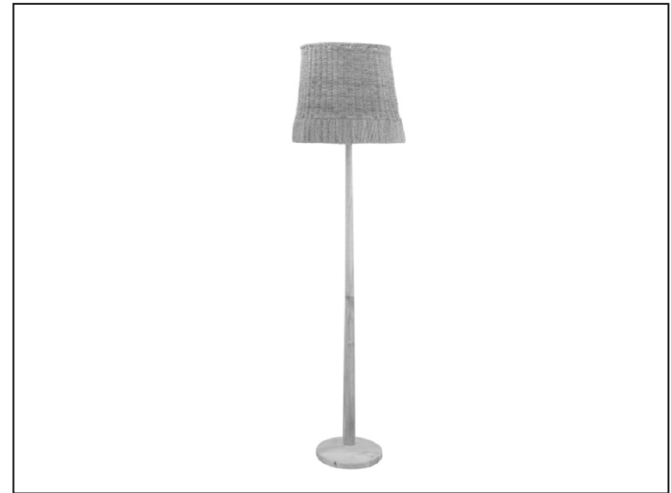
COLLECTED FLOOR LAMP 82044388

POLSKI - WAŻNA INFORMACJA Przed rozpoczęciem korzystania z tego produktu należy zapoznać się z instrukcją. Postępuj zgodnie z instrukcją dokładnie i zachowaj ją na przyszłość. Przed rozpoczęciem instalacji odłącz zasilanie. Wyłącznie do użytku we wnętrzu.